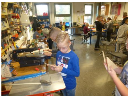
Geconcentreerd aan het werk